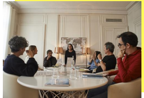
Délibération du jury 2019

Près de 2300 votants sur le site prixaliceguy.com en un mois