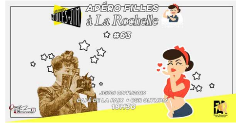
LA ROCHELLE - 7 novembre 2019 Organisé par Jules + Jim au CGR Olympia

Le Prix Alice Guy voyage en France, sous la forme de soirées spéciales mettant les réalisatrices primées à l'honneur tout en présentant le travail d'Alice Guy.