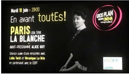
QUIMPER - 19 juin 2018 Organisé par Solenn Rousseau au Quai Duplex